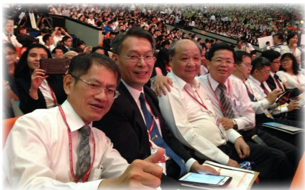
弟兄們在會場中合影

但弟兄在那兒？幾位弟兄聽了，就為此禱告。感謝主，這幾位弟兄都去參加了訓練，而弟兄就是其中之一，感謝主，現今仍在召會中服事。是的，「當人棄絕地的賄絡，前來為神而活，他所得的無限富有，口舌難以訴說…」在這世代的末了，主仍在呼召人來為神的權益而