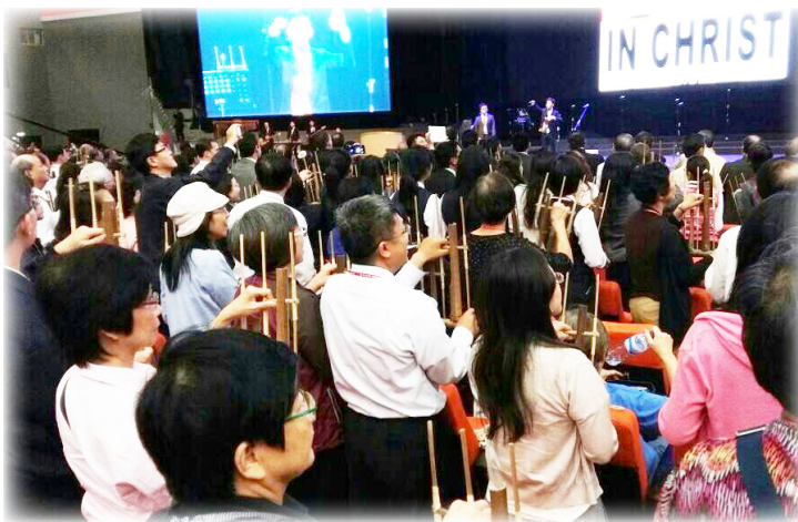
聖徒們專心看著臺上的指揮，發出自己手上的音階

十二日上午我們移宿至Bogor附近的飯店，各地的全時間學員與服事者也陸續到達。在Bogor附近的旅館幾乎都被我們包下了，因海外來了近二千位的聖徒，而本地印尼各地聖徒則來了近一萬位。