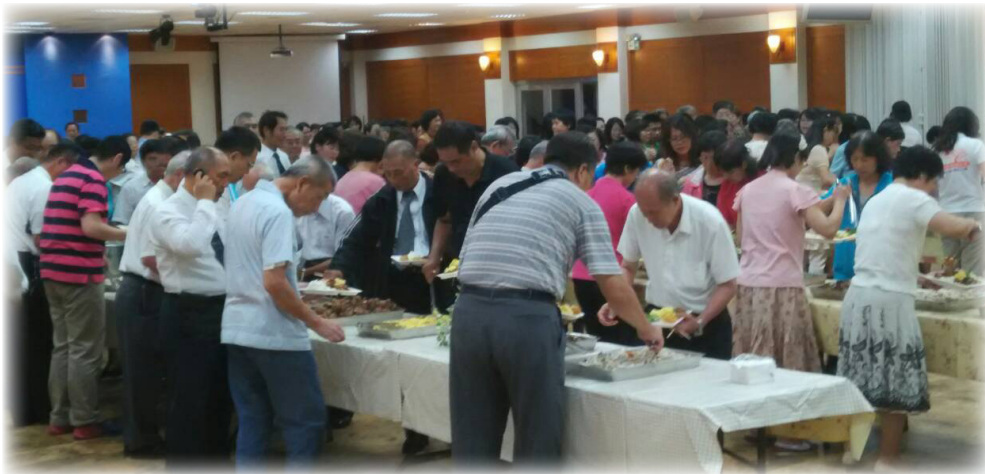
聖徒一同享受愛的筵席

使身體的豐富不僅寫在書中，更實際的顯在行動中。感謝主，願我們所蒙的恩典，都成為祂身體的祝福。