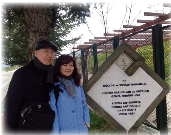
作者與姊妹在彼西底的 安提阿猶太會堂入口留影

在行傳十三章從安提阿(Antioch)出發第一次行程之前發生了兩件事：希律王下手苦害召會信徒並殺害約翰的哥哥雅各，以及彼得被捉拿。正當耶路撒冷召會陷入低沉之時，在安提阿的召會中，卻有幾位申言者和教師，就是巴拿巴和稱呼尼結的西面，古利奈人路求，與分封王希律同養的馬念，並掃羅。他們事奉主，禁食的時候，聖靈說，要為我分別巴拿巴和掃羅，去作我召他們所作的工(徒十三1-2)。伍弟兄娓娓道出這些關鍵性的經文，彷彿將我們帶到當時的時空，看到當時彼西底省(Psidia)的安提阿熱鬧的情景，羅馬拱門、