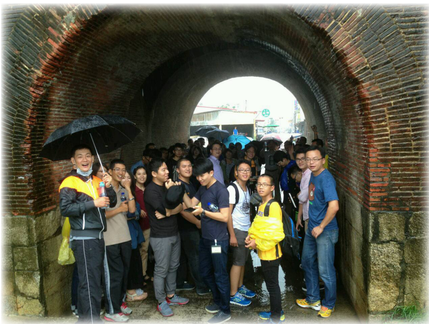
社青聖徒在恆春鎮東門留影

享受在星光夜語時與聖徒們的交通分享，彼此訴說著各自的個性上的優缺點，也分享在相調中的享受。我們也為著每位的需要一同代禱，真有同作肢體的感覺。